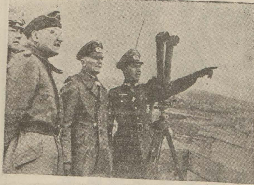
Mareşal Fon Bock bir piyade kumandanından izahat alıyor

Pars ajansı bildiriyor: Bütün İran gazeteleri Dr. Refik Saydamın ölümü münasebetile ha- raretili yazılar nesrederek dost ve komşu Türk milletinin acısına iş- tirak eden İran milletinin hisleri- ne tercüman oluyorlar.