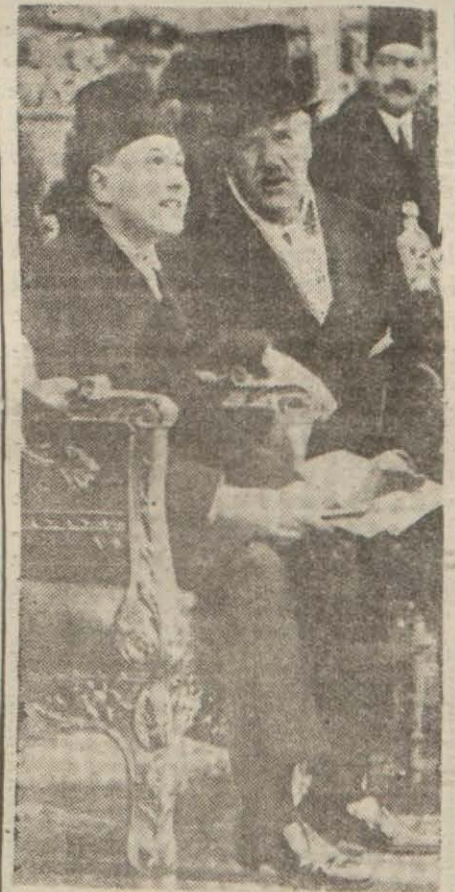
Mısır'daki İngiliz fevkalâde komi- serinin Kral F ile vevahâdîği zamanında çekilmiş bir resmi