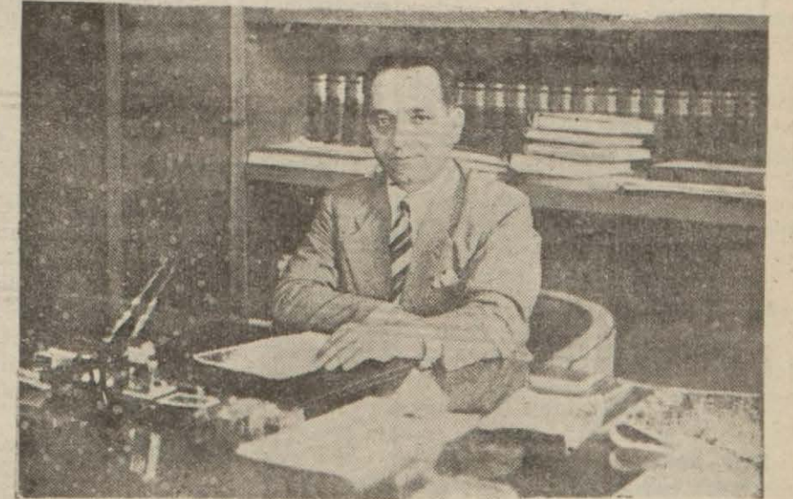
Şevket Raşid Hatiboğlu Ziraat Vekilliği makamında (Yazısını 3 üncü sayfamızda bulacaksınız)

Onun Ziraat Vekâletine getirilmesi, rejimi- mizin hakiki değerleri bulmaya verdiği önemi gösteren bir hâdisedir Yazan: Profesör doktor Sadi İrmak